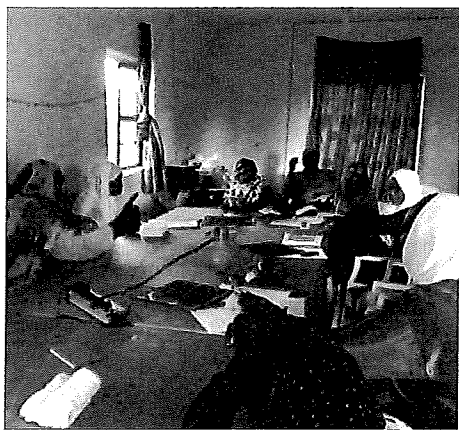
議論するチャドの女性たち

初めは技術指導でいったんですが、昨年行ったときに、彼女たちはつくった太陽光発電に値をつけているんですね。売れる値段はなにか、喧々諤々議論しているんですよ。「ここまでできたか」と思いました。難民の方ですから、大きな傷をおっていたはずなんです。それが3年経って、自分で前にすすもうという気持ちが出てきている。その場に一緒にいられるというのは、非常におもしろいですよね。